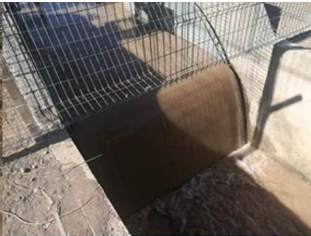
Foto 2. Canal Ramírez.