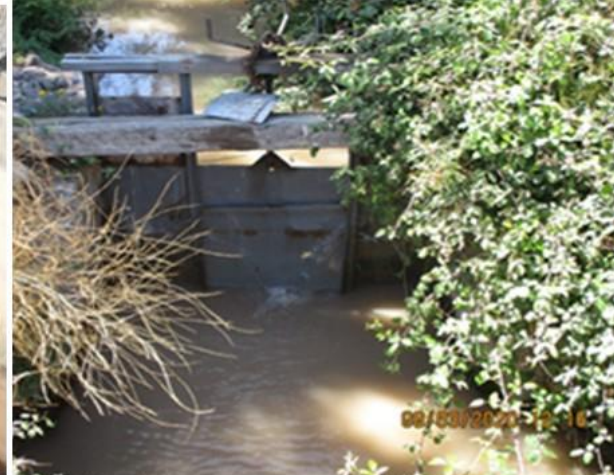
Foto 3. Canal Estancilla.