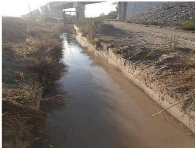
Foto 1. Canal La Pirca.