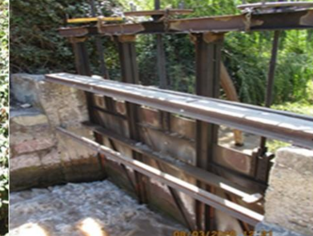
Foto 4. Canal Comunero.